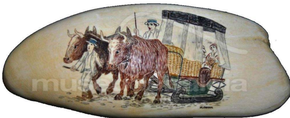
Figura 1A – Dente de cachalote gravado com a técnica do Scrimshaw (Doado ao MBM por Anne Soulaire).

Neste âmbito o desafio escolar do ano letivo 2014/2015 pretende enfatizar o percurso da instituição desde a sua formação até à atualidade. A proposta incide sobre a arte do Scrimshaw praticada pelos antigos baleeiros. O Scrimshaw é o nome dado à arte de entalhe e gravação em dentes ou mandíbulas/ossos de cachalotes, cujas gravações retratavam às vivências quotidianas. Na Madeira a técnica foi desenvolvida dando origem a inúmeras peças artísticas em exposição no MBM (Figura 1A e 1B).