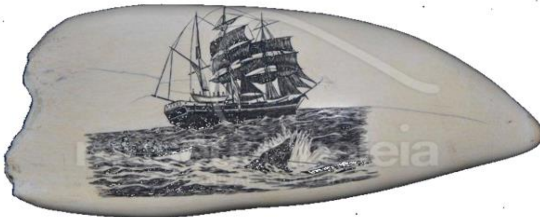
Figura 1B – Dente de cachalote gravado com a técnica do Scrimshaw (Doado ao MBM por Jacques Soulaire).